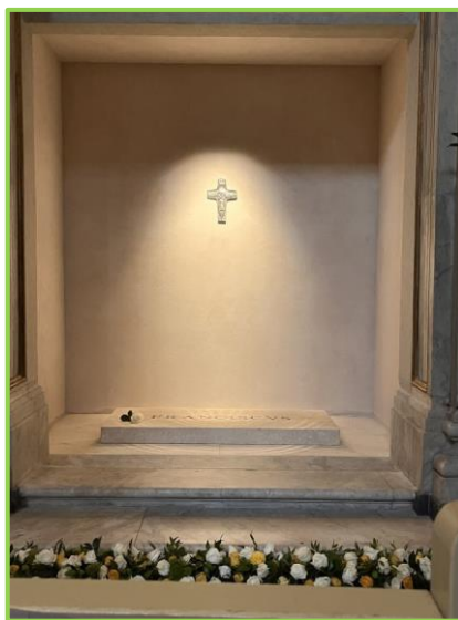
Tumba del Papa Francisco