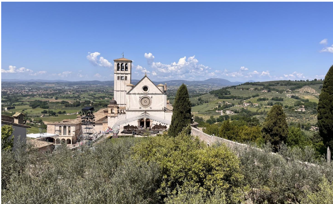
Basílica de San Francisco