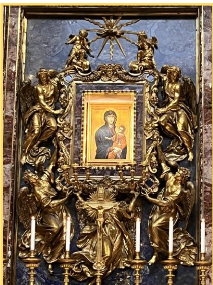
Pintura de María

El lunes después de nuestra llegada a Roma el 5 de mayo, nos dirigimos a Santa María Maggiore para rezar ante la tumba del Papa Francisco, pidiendo su intercesión por la elección del nuevo Papa y por nuestro nombramiento el 8 de mayo con el Dicasterio. También rezamos ante el Santísimo Sacramento y el cuadro de María, ante el que el Papa Francisco rezó en numerosas ocasiones. A continuación, nos dirigimos a San Pedro para entrar por la Puerta Santa, en este año jubilar de la Peregrinación de la Esperanza. Una vez más, rezamos en la Capilla del Santísimo Sacramento intercediendo por todos en nuestro Instituto y pidiendo de nuevo bendiciones especiales en nuestra visita al Dicasterio.