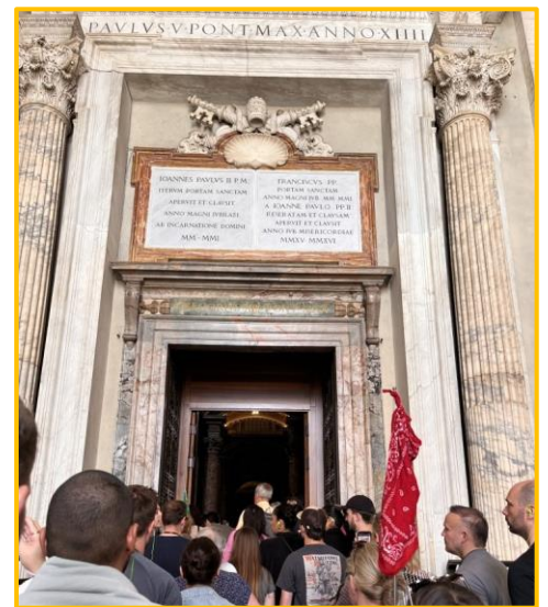
Porte Sainte de St. Peters