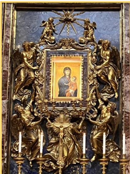
Peinture de Marie

Le lundi après notre arrivée à Rome le 5 mai, nous nous sommes rendus à Santa Maria Maggiore pour prier sur la tombe du Pape François, demandant son intercession pour l'élection du nouveau Pape et pour notre rendez-vous du 8 mai avec le Dicastère. Nous avons également prié devant le Saint Sacrement et le tableau de Marie, devant lequel le Pape François a prié à de nombreuses reprises. Nous avons ensuite marché jusqu'à St Peters pour franchir la Porte Sainte, en cette année jubilaire du Pèlerinage de l'Espérance. Une fois de plus, nous avons prié dans la chapelle du Saint-Sacrement, intercédant pour tous les membres de notre Institut et demandant une fois de plus des bénédictions spéciales pour notre visite au Dicastère.