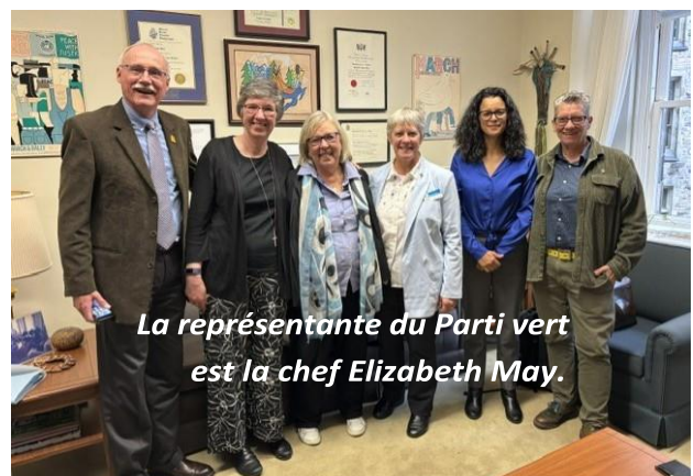
La représentante du Parti vert est la chef Elizabeth May.

https://orcie.org/learning-lobbying-2025-canada-for-global-climate-justice/