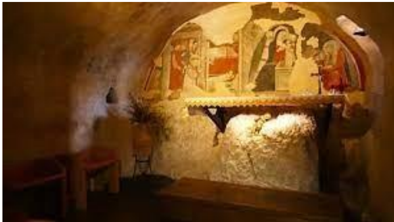
Greccio, Italie : une ancienne fresque dans la chapelle de la Nativité du sanctuaire marque l'endroit où saint François célébrait la messe

L'Avent revient comme une saison tendre de vigilance, nous invitant, tout comme saint François, à faire une pause, à respirer et à remarquer les façons discrètes dont Dieu est déjà proche.